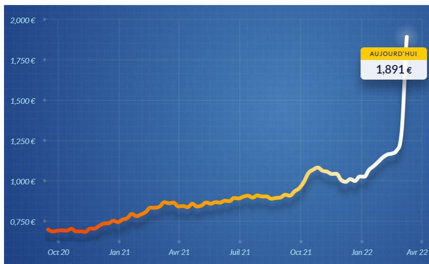
Graphique 4 – Evolution du prix du Gazole Non Routier (GNR) en EUR/L 8

La consommation retenue étant toutefois relative uniquement aux opérations réalisées sur la parcelle, il y a lieu de la réévaluer de 25 % pour tenir compte de la consommation de fuel « hors parcelle ».